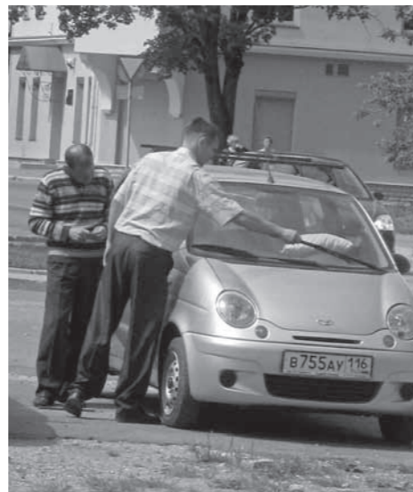
Daewoo Matiz tõi misjonärid Eestisse 1900 kilomeetri tagant.