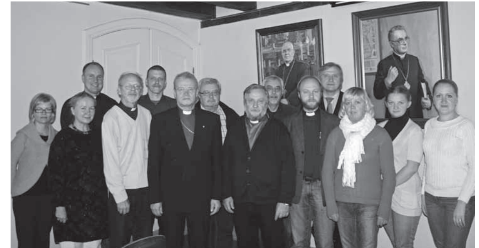
Ingeri kiriku juhtimiskoolitusel osalejad külas EELK kirikuvalitsuses.

„Ingeri nagu millise tahes muu kiriku suurim väljakutse on leida äratuskristlik töötegemise viis. On küll hea, kui meile antakse teadmisi kristlusest ja loetakse filosoofiat, aga me vajame rohkem palvetajaid ja Jumala Sõna kuulutajaid. Vajame rohujuuresandi piiblikoole, mille künnis oleks piisavalt madal tavalistele inimestele. Tänapäeval õpetatakse pastoreid liturgiakeskseks ning probleem on, et nad ei austa piisa-