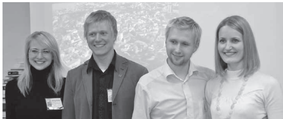
Agape Eesti töötajad Soome Rahva Piibliseltsis.

Siis, kui oleme nähtaval, ei mahu me vist kaardrisse... Jah, peab tõdema: tänapäeval ei märka haritud eestlane kirikus vist enam kui propagandat ja hirm on suur selle ees, et kirik „värbab“ uusi inimesi. Kirikupäevad aga koguvad hoogu ja järgmised kujunevad kindlasti mõjukaks usutunnistuseks, mis ühendab nii nähtavaid kui ka nähtamatuid kristlasi.