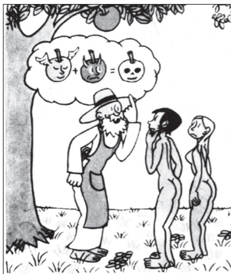
Nõukogude eestlase piibliõpe Jean Effeli põhjal: Jumal hoiatab esimesi inimesi maitsmast hea ja kurja tundmise puust. Repro teosest „Aadama ja Eeva armastus“, kirjastus Kunst 1975.