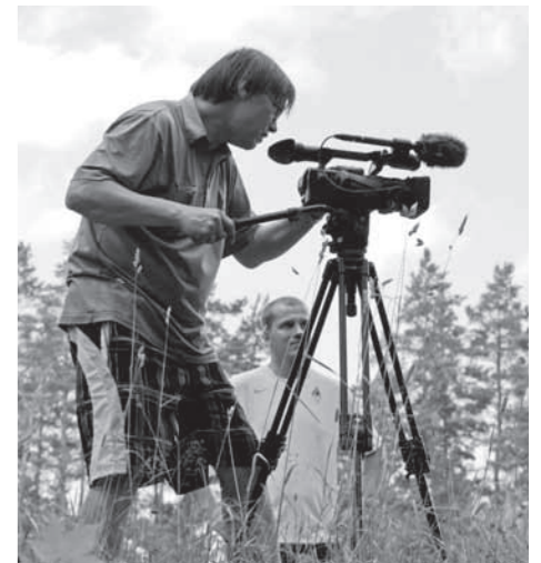
...ning režissöörile pingelisi töötunde.